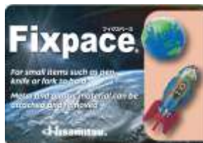
Fixpace ® (フィクススペース)