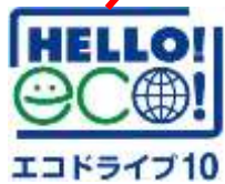
車両用ステッカー