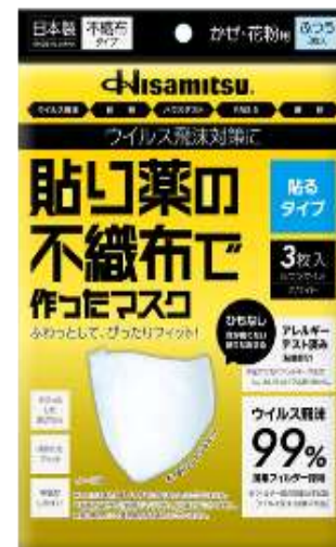
【耳掛けタイプ】 【貼るタイプ】