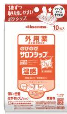
のびのび ® サロンシップ ® フィット ® H