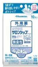
のびのび ® サロンシップ ® フィット ® α