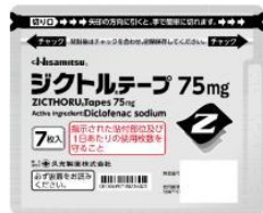
ジクトル ® テープ75mg