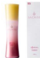
ライフセラ ® サクライズ ® 化粧液