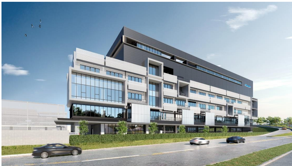
新研究所(イメージ図)