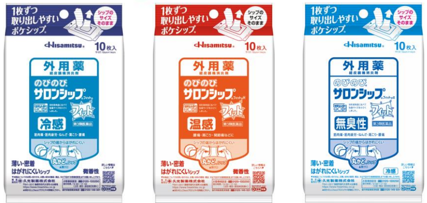
貼付剤(医薬品)で唯一受賞 *当社調べ