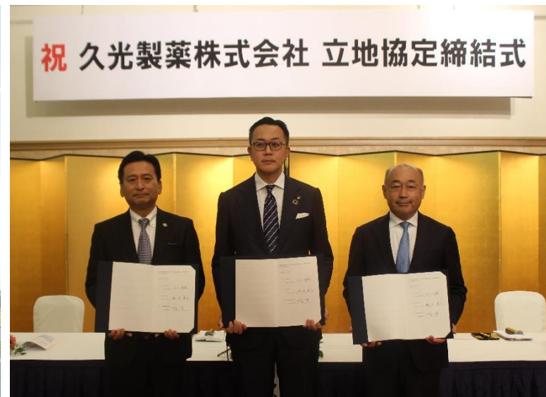
立地協定締結式の様子