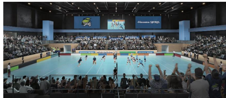
(メインアリーナ イメージ)