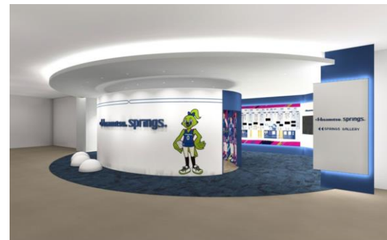
(スプリングスギャラリー イメージ)