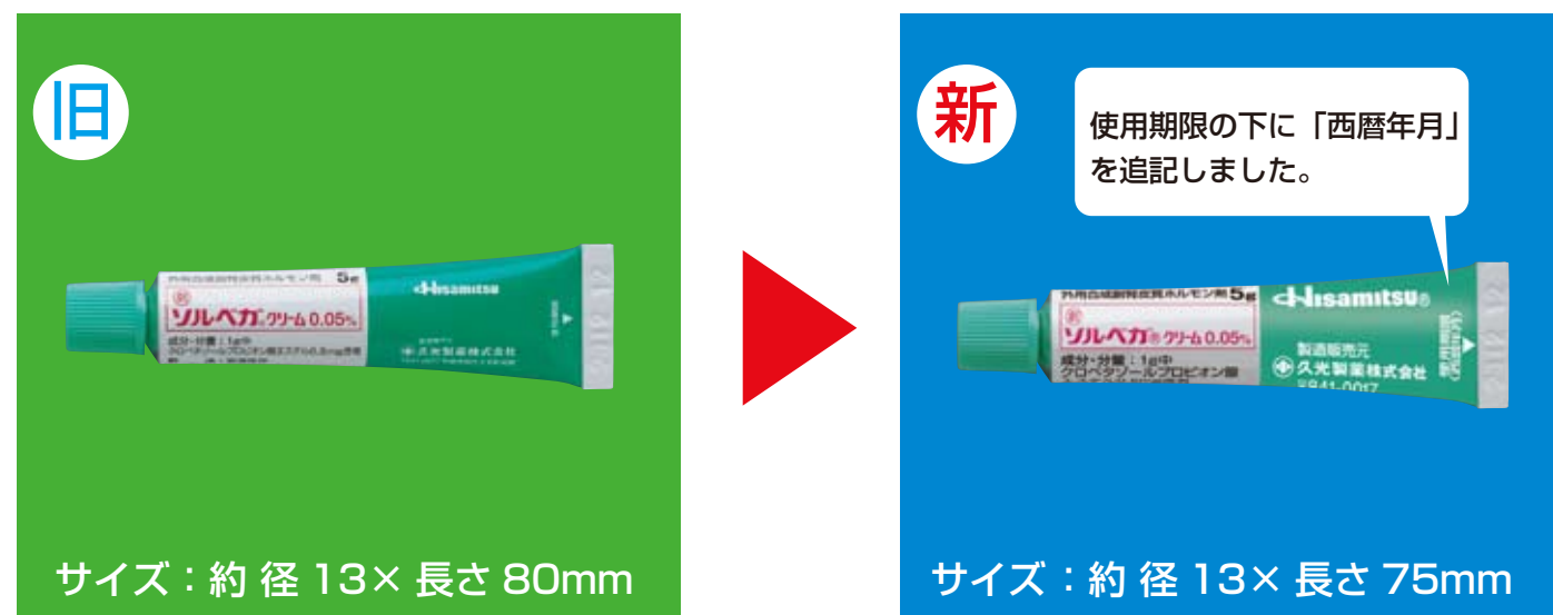
旧 サイズ：約径13×長さ80mm